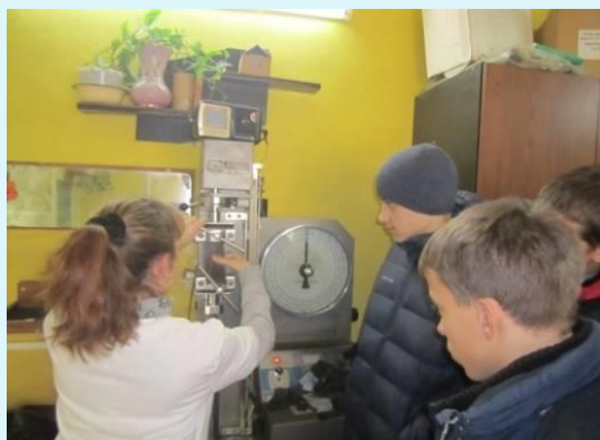
Котовский завод нетканых материалов